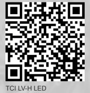
TCI LV-H LED